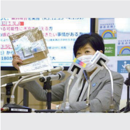
「オミクロン株」の市中感染事例を受け、PCR検査などを呼び掛ける小池百合子知事

新型コロナの感染拡大が始まった2019年の末では新型コロナの正体がわからず、世界全体が「ゼロコロナ」を目指し対策を取った。それが症状があれば即検査・即受診・即隔離の体制だった。