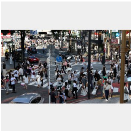
全国の感染者数は26万人を突破