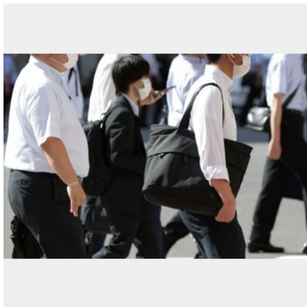
マスク着用が緩和されるが…

そもそも換気とは「室内の汚れた空気を室外の新鮮な空気に入れ替えること」を意味し、「室内の汚れた空気」とは、二酸化炭素、一酸化炭素、ハウスダスト、細菌、ウイルスなどを指す。多くの人は換気というと換気扇を回す、窓などを開けて、自然と空気が入れ替わることをイメージしがちだ。